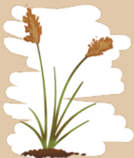
Le riz de Camargue

FAUX ! Les variétés très utilisées par les paysans qu'ils mettent en avant ne sont pas réglementées comme OGM.