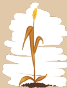
Le blé renan

irradiation des graines non réglementé au niveau européen